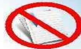
Справочные материалы, письменные заметки

*непрограммируемый калькулятор разрешается использовать на экзаменах по химии, биологии, физике, географии