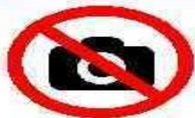
Фото, аудио и видеоаппаратуру