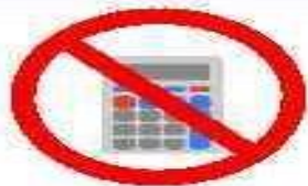
Электронно- вычислительную технику*

*непрограммируемый калькулятор разрешается использовать на экзаменах по химии, биологии, физике, географии